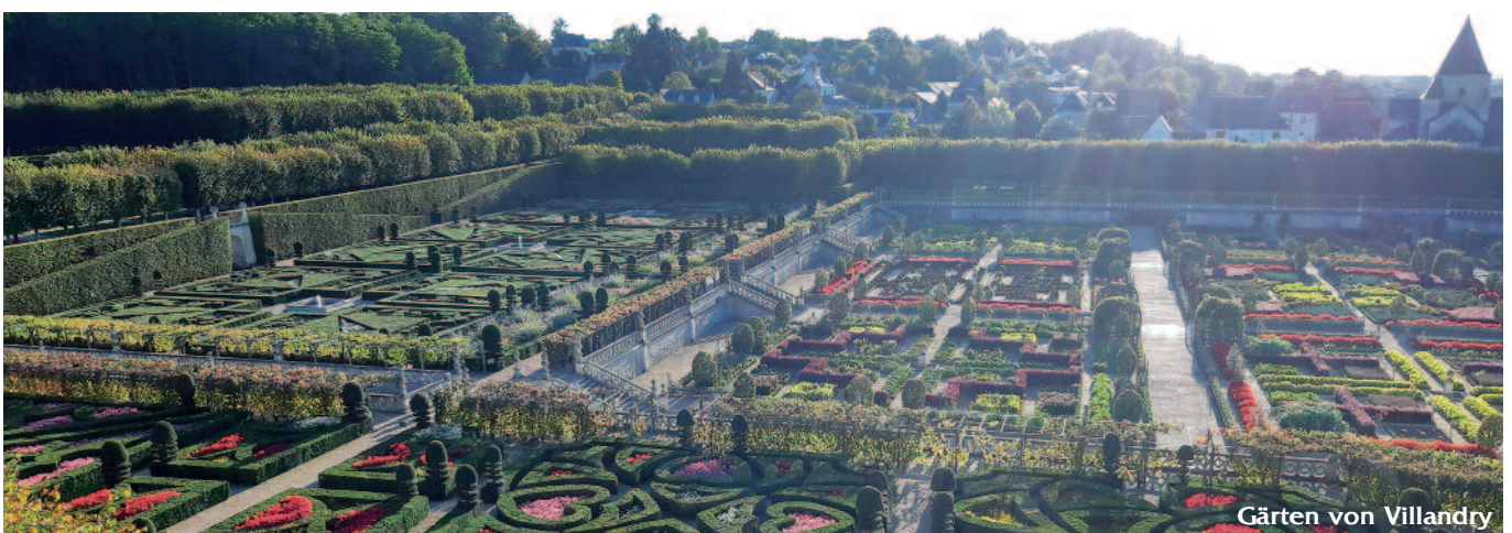
Gärten von Villandry