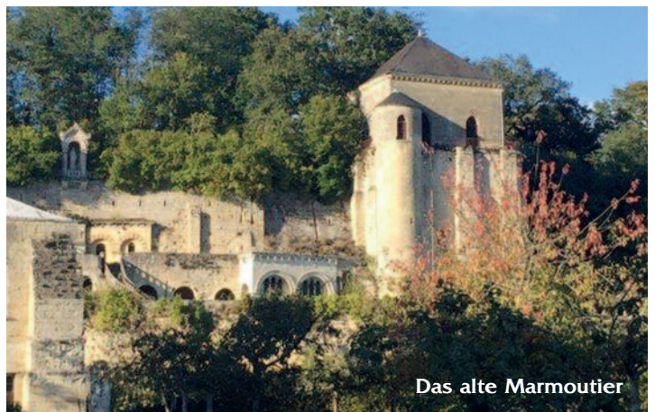
Das alte Marmoutier