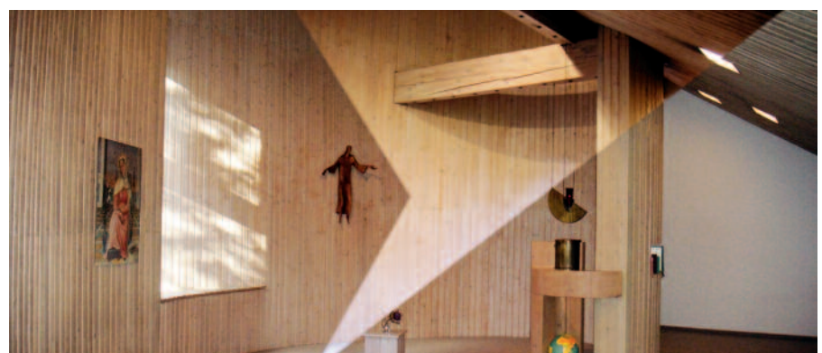
Kapelle der Schwestern in der Sch rgelgasse

Graz ist neben Wien der zweite Standort, an dem sich noch eine Schwesterngemeinschaft des Sacr  Coeur befindet.