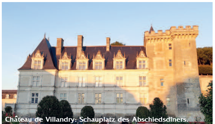
Château de Villandry: Schauplatz des Abschiedsdiners.